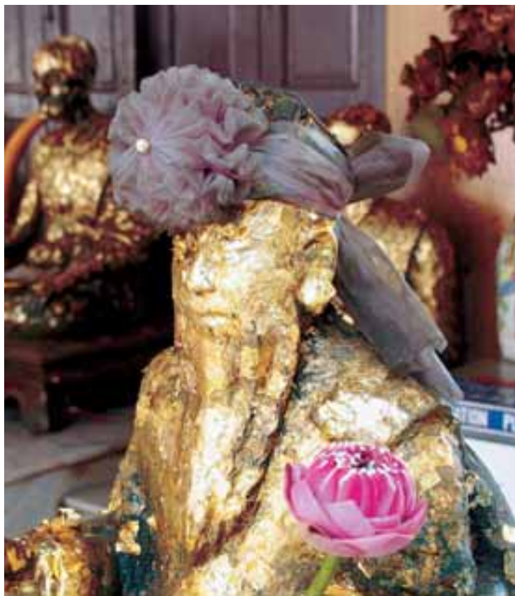
Kipovi Budhe u Bangkoku su sveprisutni