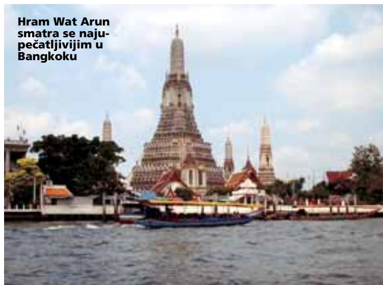
Hram Wat Arun smatra se najupečatljivijim u Bangkoku

► Moderna azijska metropola koja se prostire na 560 četvornih kilometara, s više od deset milijuna stanovnika, izrazito je urbanizirana iako se na svakome koraku osjeća duh tradicionalne tajske kulture